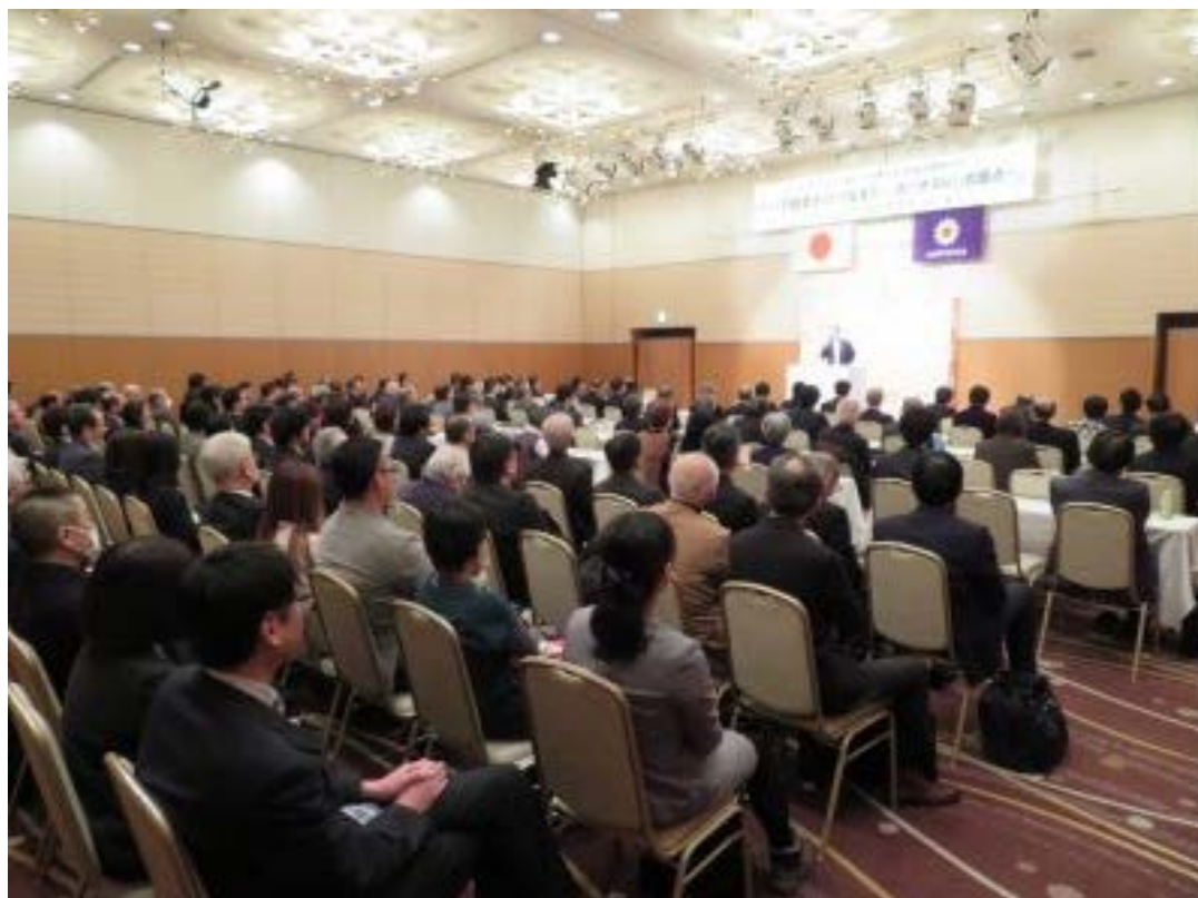
セミナー会場の様子