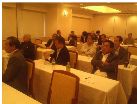
平成25年10月13日 北見ピアソンホテル