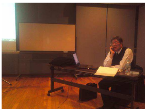
平成25年11月29日 北見芸術文化ホール

日 時 平成25年12月11日(水) 14:00~17:00 場 所 網走エコセンター 内 容 「日行連自動車登録OSSセンタ ーに係る」DVD業務研修